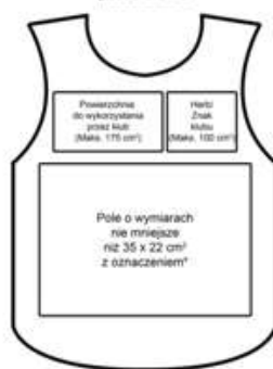
STANDARDOWE ZAGOSPODAROWANIE POWIERZCHNI -przód znacznika